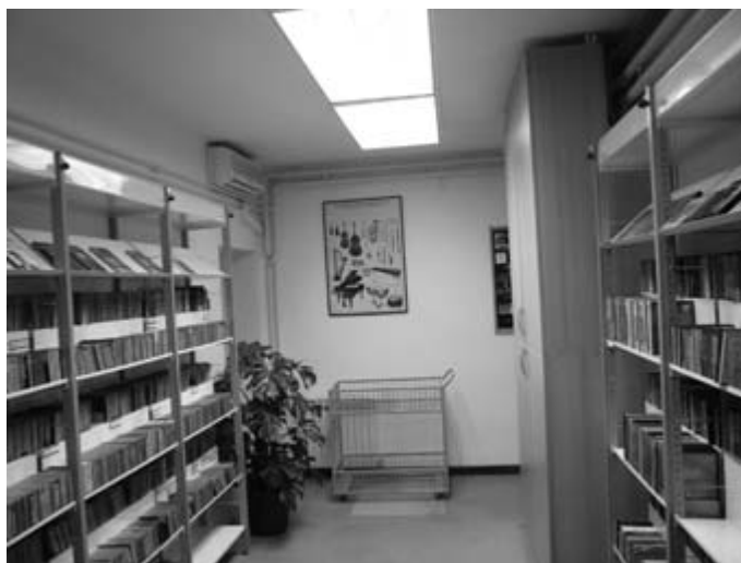
Глазбени одјел Градске књижнице

Тијеком 1950. године, из књижног фонда Градске књижнице издвојен је дио књига које су по свом садржају и литерарној вриједности биле намијењене дјеци. Тако је настала Пионирска посудбена књижница и читаоница, која ће прерасти у сувремени Одјел за дјецу и младеж с Медиотеком Градске књижнице. Уз већ традиционалне образовно-потицајне програме, тијеком Домовинског рата, Градска књижница је била водитељ и координатор UNICEF-овог психосоцијалног и креативног пројекта Корак по корак до опоравка за Републику Хрватску (22 народне књижнице), за подршку избјеглицама и дјеци погођеној ратним траумама. Данас Одјел за дјецу и младеж с Медиотеком пружа стручну помоћ у кориштењу своје збирке на различитим медијима, уприличује разноврсне приредбе, стваралачке радионице (преко 600 годишње), квизове знања и остале активности примјерене доби корисника.